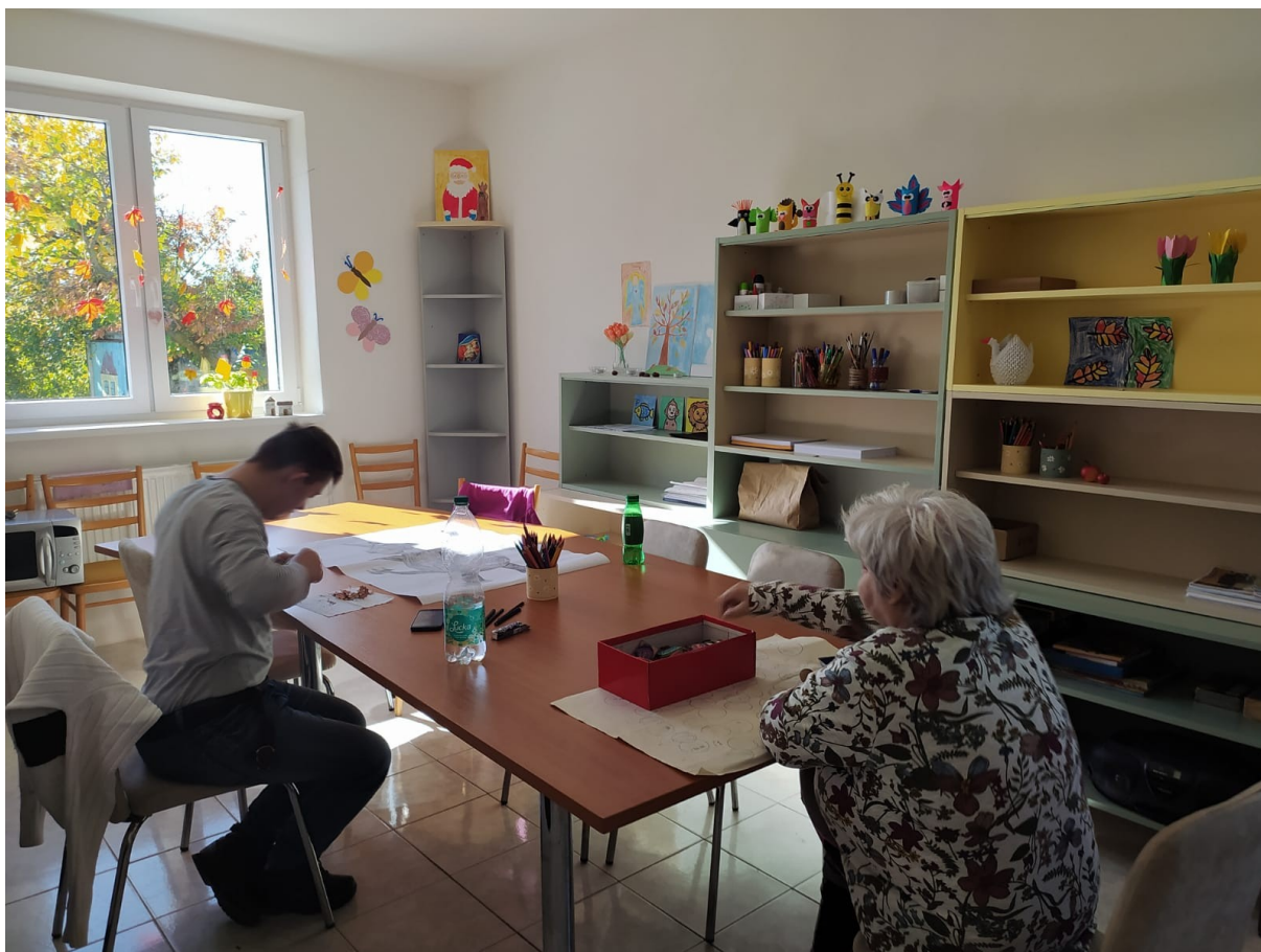
Fotky z projektu Denný stacionár Vištuk v prevádzke

Leták, ktorý v spolupráci s nami vypracovala členka sociálnej komisie v obci Doľany, informujúci o našich službách